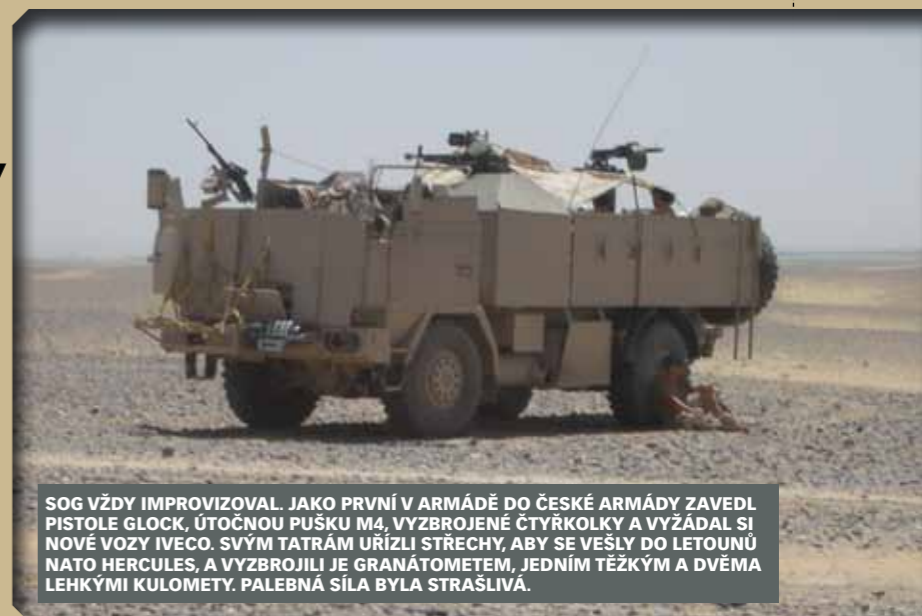
SOG VŽDY IMPROVIZOVAL. JAKO PRVNÍ V ARMÁDĚ DO ČESKÉ ARMÁDY ZAVEDL PISTOLE GLOCK, ÚTOČNOU PUŠKU M4, VYBROJENÉ ČTYŘKOLKY A VYŽÁDAL SI NOVÉ VOZY IVECO. SVÝM TATRÁM URĪZLI STŘECHY, ABY SE VEŠLY DO LETOUNŮ NATO HERCULES, A VYBROJILI JE GRANÁTOMETEM, JEDNÍM TĚŽKÝM A DVĚMA LEHKÝMI KULOMETY. PALEBNÁ SÍLA BYLA STRAŠLIVÁ.

něj mohla přistát helikoptéra. My jsme se zničenou čtyřkolku přiváženou za tatrou jeli na základnu po zemi. Britové se nám smáli, že vrak nezničme.