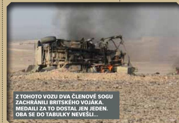
Z TOHOTO VOZU DVA ČLENOVÉ SOGU ZACHRÁNILI BRITSKÉHO VOJÁKA. MEDAILI ZA TO DOSTAL JEN JEDEN. OBA SE DO TABULKY NEVEŠLI...

Když stojíte před dveřmi, jste napumpovaný adrenalinem. Existuje poučka: počítej s nejhorším, a doufej v lepší. Může tam být