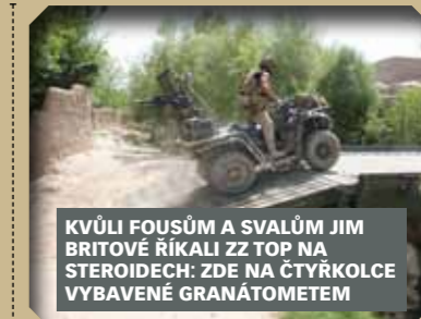
KVŮLI FOUSŮM A SVALŮM JIM BRITOVÉ ŘÍKALI ZZ TOP NA STEROIDECH: ZDE NA ČTYŘKOLCE VYBAVENÉ GRANÁTOMETEM

Protože česká armáda je svázána nesmyslnými předpisy. Když Američani nebo Britové přijdou o obrněný vůz, rozstřílejí ho na kusy, aby nepadl do rukou nepříteli, a do kolonky si zatrhnou: ztraceno v boji. Kdybych to udělal já, čtyřkolku bych si musel zaplatit. Byl jsem tři týdny ve válce