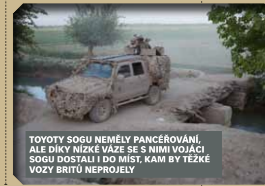
TOYOTY SOGU NEMĚLY PANCĚROVÁNÍ, ALE DÍKY NÍZKÉ VÁZE SE S NIMI VOJÁCI SOGU DOSTALI I DO MÍST, KAM BY TĚŽKÉ VOZY BRITŮ NEPROJELY

Největší potíž gerilové války jsou nástražná výbušná zařízení a sebevražední atentáčníci. Když proti vám někdo střílí, můžete se bránit,